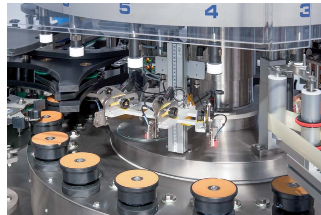
Orientamento ottico giunta vetro bottiglia Bottle seams optical orientation Dispositivo de orientación óptica de la costura en el vidrio