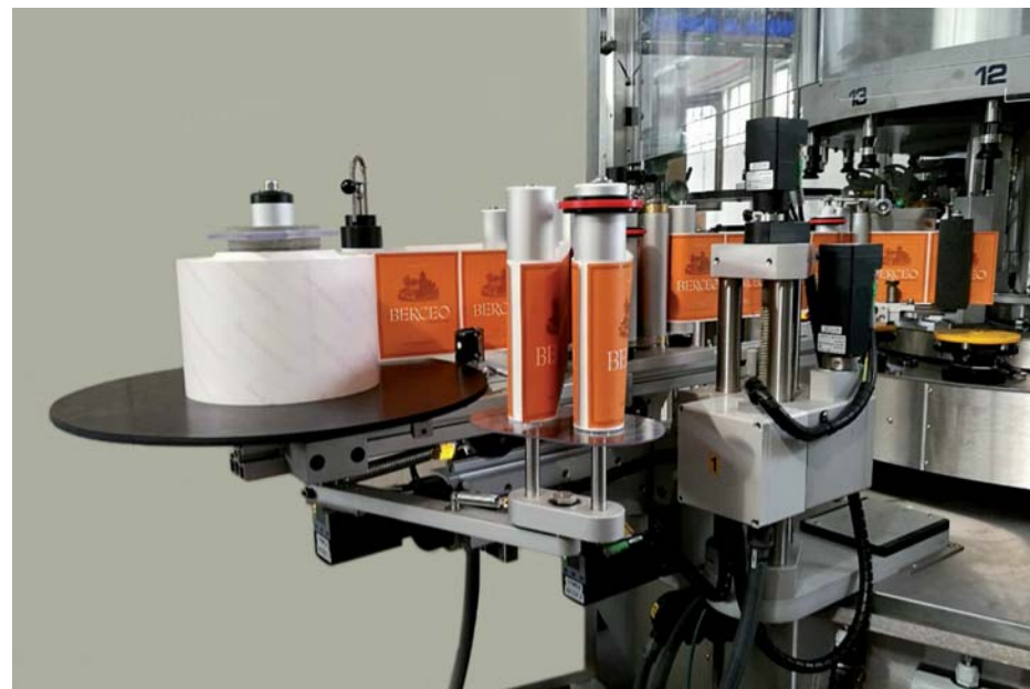
Stazione YPS con 4 assi controllati da servomotori YPS station with 4 axes controlled by servomotors Cabezal YPS con ajuste motorizado en 4 ejes por servomotores